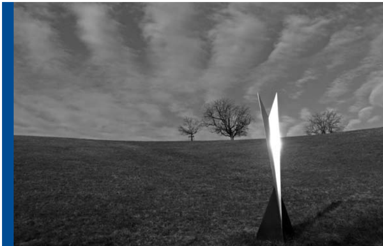
Künstler: H.P. Gurski, Eigentümer: Andreas Felger

zu können. Das Glockengeläut, die Schlichtheit und Geschichte des Raumes, die Ruhe dort, ... das alles berührt mich immer wieder neu und weckt eine besondere Sehnsucht in mir. Die Zeichnung der Kirche in einem meiner Moleskine-Skizzenbücher ist einmal entstanden während des Wartens auf ein Abendgebet.“