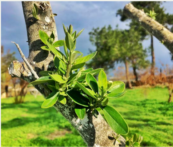
Stamm eines verbrannten Olivenbaums in Latrun: Das Neue wächst aus dem Alten hervor.