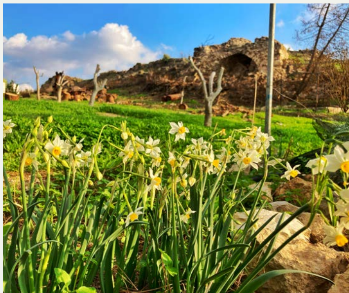
Blick von der Kommunität Latrun zur Ruine der Kreuzfahrerbürg. Hier war alles verbrannt, jetzt blüht es wieder auf.

Nach dem Feuer stehen für die Außenkommunität in Israel Veränderungen an