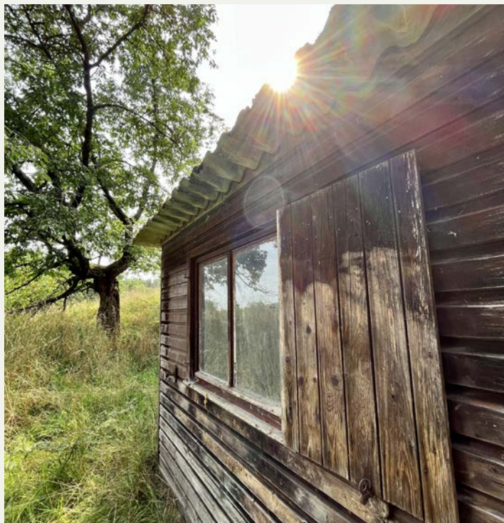
Altes Gebetshüttchen auf dem Gelände unterhalb des Brüderhauses.

Die Angebote im Haus der Stille erfreuen sich großer Beliebtheit und sind nicht selten frühzeitig ausgebucht. Neben den bewährten Stillen Wochenenden setzt das Programmteam jedes Jahr auch neue Akzente. Die Impulse-Redaktion hat Sr. Birgit-Salome gebeten, die besonderen Angebote des Jahres 2026 kurz vorzustellen.