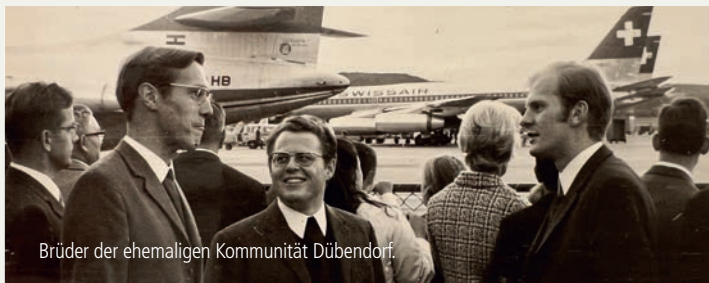
Brüder der ehemaligen Kommunität Dübendorf.

Die 1960er und 70er Jahre waren Jahre des Aufbruchs. Nicht nur in Politik und Gesellschaft, sondern auch in der Kirche. Junge Menschen waren begeistert von neuen Gebetsformen, vom Reden und Handeln des Heiligen Geistes und vom Gedanken, unter seiner Führung ganz Nachfolge Jesu Christi zu leben. Es entstanden neue Gemeinschaften, Gruppen und Kreise. Mehr und mehr suchten Verantwortliche über Landes- und Konfessionsgrenzen hinweg, Einheit zu leben, so wie es Jesus in Johannes 17 vom Vater im Himmel erbeten hatte.