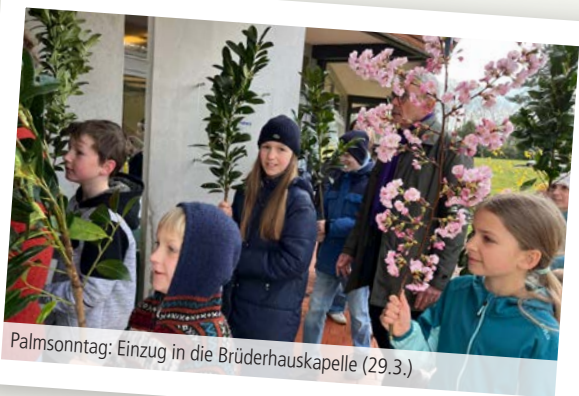
Palmsonntag: Einzug in die Brüderhauskapelle (29.3.)