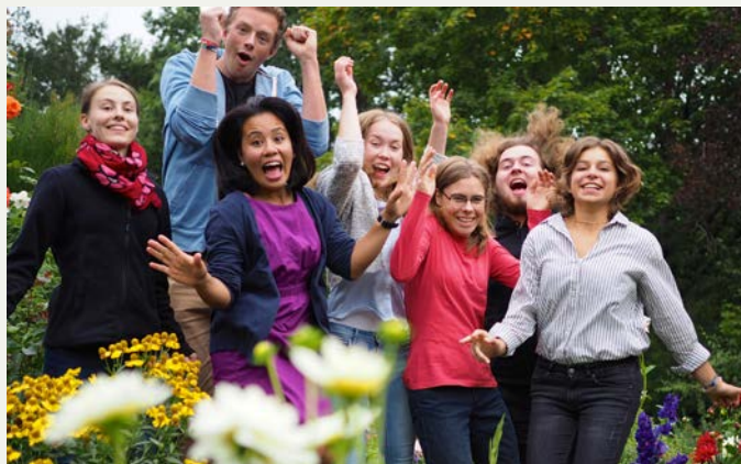
Das Jahresteam von 2015/16

In den 1980er-Jahren begann die Arbeit im Nehemia-Hof als Familienbildungsstätte (siehe Impulse 1/2026). Die Finanzkrise der Jesus-Bruderschaft zu Beginn der 2000er-Jahre verstärkte die Notwendigkeit, die Wirtschaftlichkeit der Arbeit stärker in den Blick zu nehmen und betriebliche Strukturen zu schaffen. Das betraf auch den Nehemia-Hof. Hier galt es, das Profil als Kinder- und Jugendgästehaus auszubauen und die Angebote in diese Richtung weiterzuentwickeln. Einige Streiflichter aus dieser Zeit: