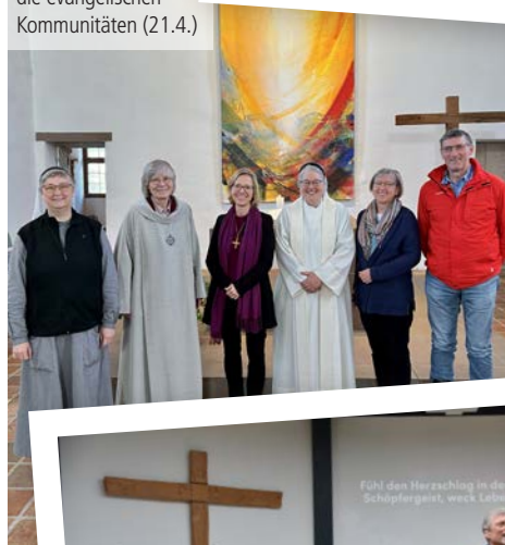
Einführung von Bischöfin Nora Steen (3. v. l.) als neue EKD-Beauftragte für die evangelischen Kommunitäten (21.4.)