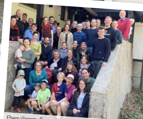
Ehemaligentreffen anlässlich 40 Jahre Nehemia-Hof (2.5.)