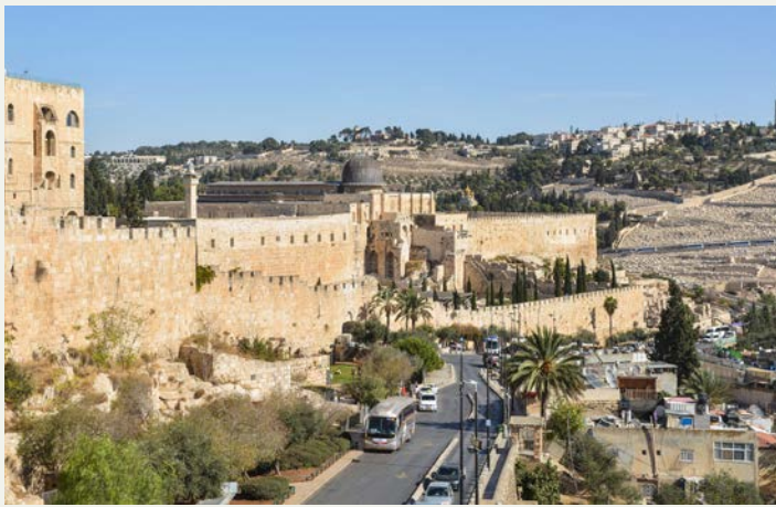
Die historische Stadtmauer Jerusalems heute