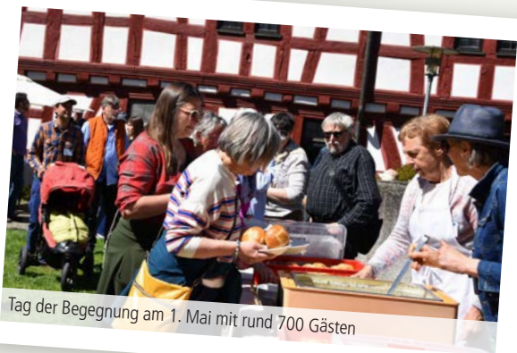
Tag der Begegnung am 1. Mai mit rund 700 Gästen