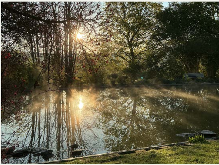
Der Teich am Brüderhaus wird gerne von Gästen zum Verweilen aufgesucht.