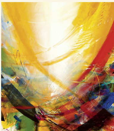
Gottesdienst an Sonn- und Feiertagen

L+A Und wohin wir gehen, dahin kommt nun auch der Herr.