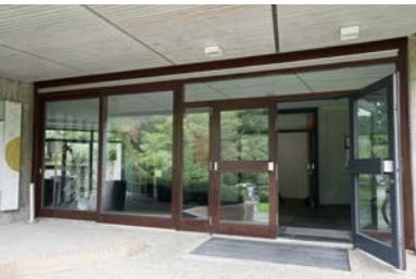
Eingang Haus der Stille