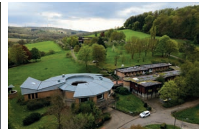
Sicht von oben