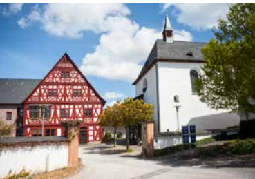
Abtissinnenhaus und Klosterkirche