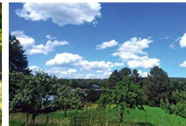
Obstbäume am Haus der Stille