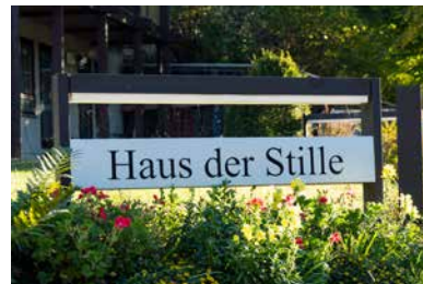
Vor dem Haus der Stille